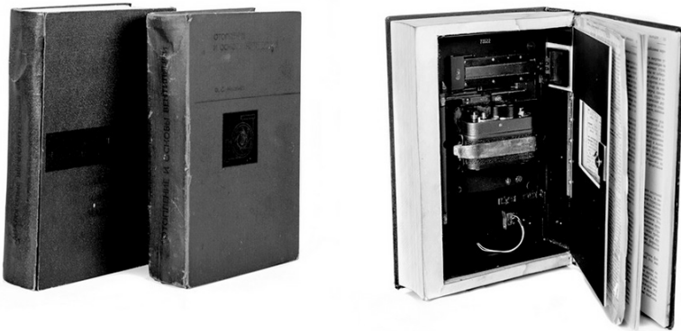
Sovietų KGB laboratorijose sukurtos knygos su įtaisyta kamera ir garsą įrašancia įranga.

Mokslas deramą dėmesį skiria ir televizijai kaip šnipinėjimo įrankiui. Žvalgybos srityje dirbantys mokslininkai sukūrė moteriško rankinuko dydžio TV kameras su įtaisytais tranzistoriais, maitinamais klausos aparatų baterijomis. Dėl mažo dydžio jas lengva paslėpti, pavyzdžiui, lentynoje už knygų, pritvirtinant po stalu arba stalčiuje, po apatiniais drabužiais. Šiose TV kamerose įmontuoti vaizdą fiksuojantys išmanieji lęšiai, kuriuos sudaro plonas lankstus strypelis. Jį galima pakisti po durimis į užrakintą kambarį, prakišti pro rakto skylutę ir net pro siaurą sienoje iškaltą skylę. Šis lankstus strypelis, sulenktas stačiu kampu, laužia šviesą ir perduoda vaizdą. Šio tipo kameros nėra plačiai naudojamos, bet kartais jos gali agentui neįtikėtina padėti.