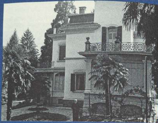
Prelatas Kazimieras Steponas Šaulys prie Šv. Brigitos vienuolyno svečių namų, 1992–1998 m.