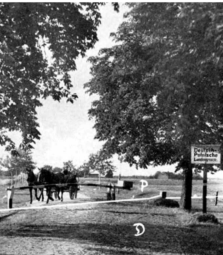
Prieškario Lenkijos ir Vokietijos siena. Šioje nuotraukoje raide D pažymėta Vokietijos, o raide P - Lenkijos teritorija.