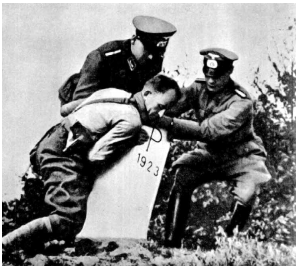
Įsiveržimo į Lenkiją pradžia. Vokiečių karininkai verčia 1923 m. pastatytą Lenkijos valstybės sienos stulpą.

Radomą artėjo prie Varšuvos ir rugsėjo 8 d. pasiekė Gura Kalvariją (lenk. Góra Kalwaria ) – miestelį Varšuvos pietvakariuose. Taip klostantis įvykiams, didelė stipri lenkų kariuomenės dalis prie Radomo buvo apsupta ir priversta sudėti ginklus. Generolo J. Blaskovico vadovaujama 8-oji armija sėkmingai stūmė lenkus nuo abiejų Lodzės pusių Bzuros upės link.