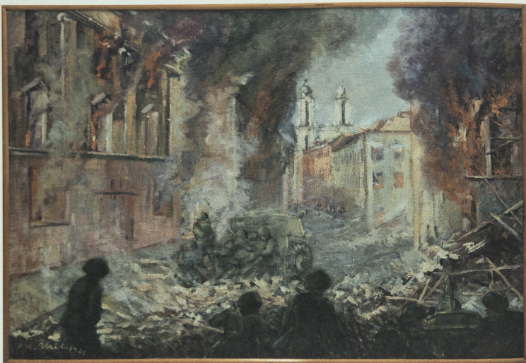
Jonas Vaitys (1903–1963) Kovos dėl Vilniaus, 1945 Drobė, aliejus, 131 × 90 Vytauto Didžiojo karo muziejus

Sovietiniame pasakojime „Didįjį tėvynės karą“ (DTK) sutapatinus su II pasauliniu karu, praktiškai eliminuotas Sąjungininkų pajėgų indėlis į pergalę prieš Ašies valstybes. Sovietinės „pergalės“ naratyvas išimtinai aukštino SSRS vaidmenį sutriuškinant Trečiąjį Reichą ir Šaltojo karo sąlygomis leido Vakarų demokratijas tapatinti su atsinaujinančia fašizmo grėsme.