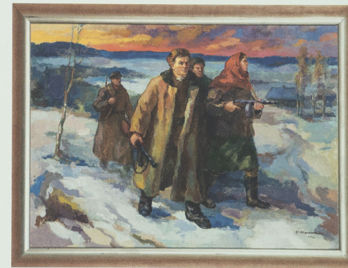
Vytautas Mackevičius (1911–1991) Partizanai, 1946 Drobė, aliejus, 120 × 164 Privati kolekcija

Partisans, pre-1973 Author's copy. Bearing the inscription: "To Comrade Antanas Sniečkus on his birthday. Comrades in arms and labour, 7 January 1973." Canvas, oil, 86 × 112 National Museum of Lithuania