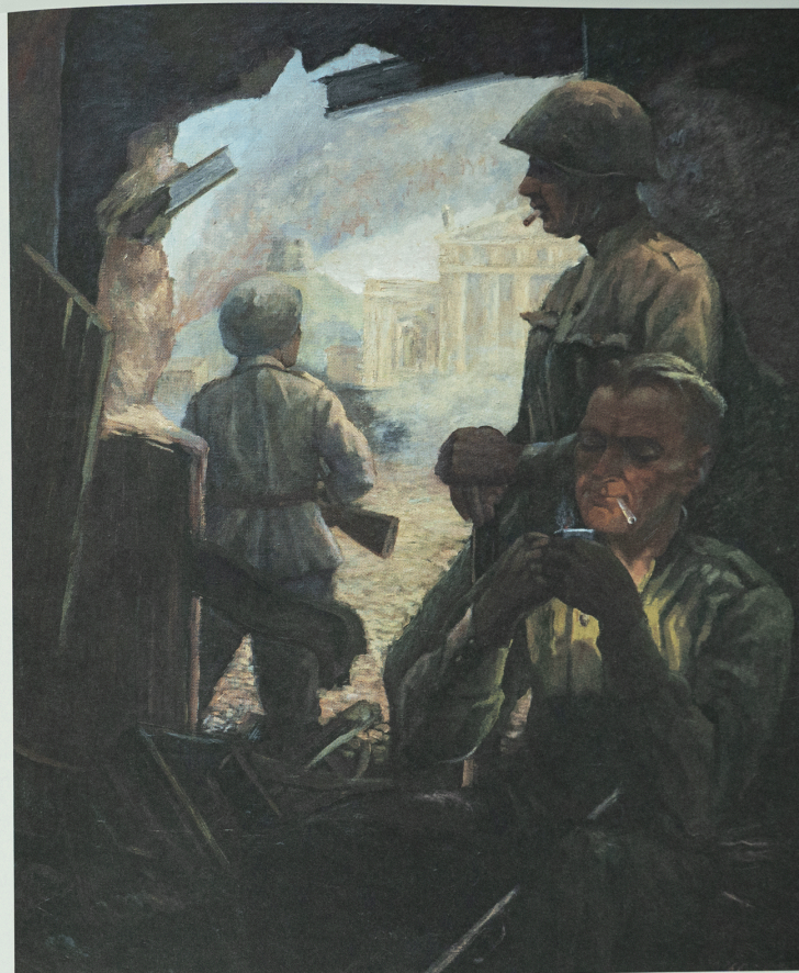
Jonas Vaitys (1903–1963) Iš kovų dėl Vilniaus, 1947 Drobė, aliejus, 131 × 114 Nacionalinis M. K. Čiurlionio dailės muziejus

The stories of the “liberation” of Europe, inspired by supposedly humanitarian ideals, and the Soviet “victory” in the war are among the most enduring ideological relics of the GPW. In this narrative, the USSR assumed the role of the victim, standing up to fight a just war for its own survival, while this role of a fighter for democracy and peace enabled the USSR to portray itself as a force liberating the world from fascism.