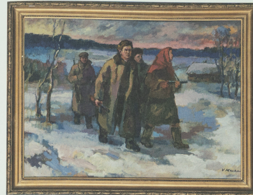
Vytautas Mackevičius (1911–1991) Partizanai, iki 1973 Autorinė kopija. Užrašas: „Draugui Antanui Sniečkui jubiliejaus proga. Kovos ir darbo draugai 1973 m. sausio 7 d.“ Drobė, aliejus, 86 × 112 Lietuvos nacionalinis muziejus

The three versions of the paintings differ slightly. The 1946 work, considered the original, was painted in sombre colours. The piece that found its way back from Sweden to a private collection has a much more vivid colour palette, and the cap worn by the lead figure bears a red star. The later author's copy was transferred to the collection of the National Museum of Lithuania after the death of Antanas Sniečkus, First Secretary of the Lithuanian Communist Party. Until then, the painting had hung in the Sniečkus family home in Vilnius, demonstrating the special attention paid to Mackevičius' work by Soviet Lithuanian functionaries.