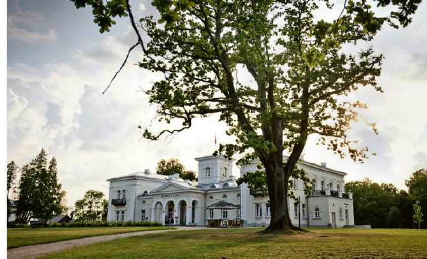
Burbiškio dvaro rūmai

Rašytiniuose šaltiniuose Burbiškio dvaras minimas nuo XVII a. Tuo metu jis priklausė Lietuvos Didžiosios Kunigaikštystės iždui ir valdovas buvo paskyręs jį valdyti Pinsko iždininkui Trojanui Nepočičkiui. XVIII a. pradžioje dvaras atiteko