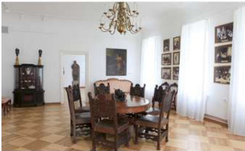
Aristokratų Tiskevičių garbei pavadinta salė

ir kitais augalais, suformuotas krioklys, upeliai su žuvytėmis. Tuo metu tai buvo didžiausias ir įspūdingiausias privatus žiemos sodas visoje Europoje.