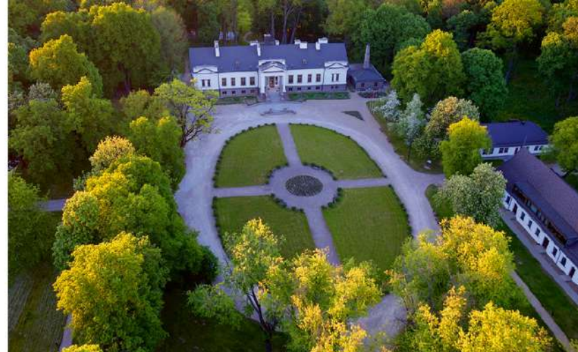
Gelgaudiškio dvaro rūmai