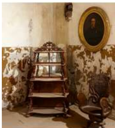
Dvaro rūmų interjero fragmentas

Rojaus kelio ir Seredžiaus miestelio kaimynystėje Lietuvos upių tėvą Nemuną nuo aukštos terasos stebi Belvederio dvaro sodyba. 1830–1840 m. statyti romantizmo stiliaus kelių dvilaukščių korpusų dvaro rūmai su masyviu apžvalgos bokštu priklausė turtingai Burbų giminai, kuri valdas perpirko iš grajų Tiškevičių.