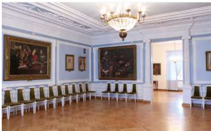
Kretingos dvaro rūmų Baltoji salė