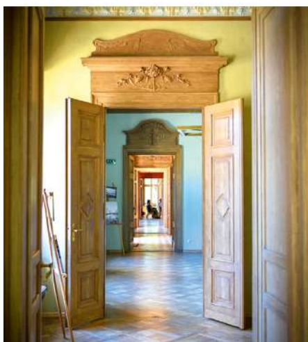
Prabangus rūmų interjeras

Dvaro parke plyti „žvaigždė“ – aštuoniomis pasaulio šalių kryptimis iškirstos proskynos. Šioje vietoje per medžiokles pietaudavę dvarininkai panoro valgydami geriau matyti žvėris, dėl to įsakė iškirsti proskynas.