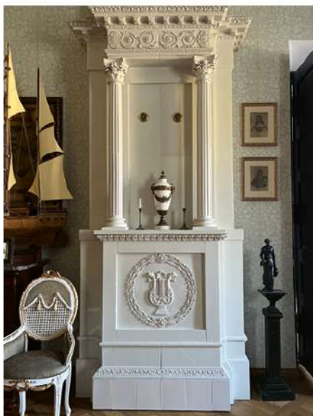
Darbo kambario fragmentas

Rašytiniuose šaltiniuose Burbiškio dvaras minimas nuo XVII a. Tuo metu jis priklausė Lietuvos Didžiosios Kunigaikštystės iždui ir valdovas buvo paskyręs jį valdyti Pinsko iždininkui Trojanui Nepočičkiui. XVIII a. pradžioje dvaras atiteko