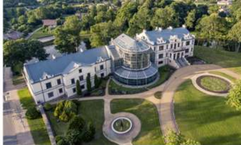
Kretingos dvaro rūmai iš paukščio skrydžio

Kretingos dvaras mena daugiau nei 500 metų Lietuvos istoriją. Su jo vardu siejamos pačios garbiausios ir didingiausios Lietuvos didikų giminės, tokios kaip karališkoji šeima, Chodkevičiai, Sapiegos, Potockiai, Masalskiai, Zubovai ir Tiškevičiai. Tai vienas iš nedaugelio šalies dvarų, išsaugojusių beveik visus buvusius statinius.