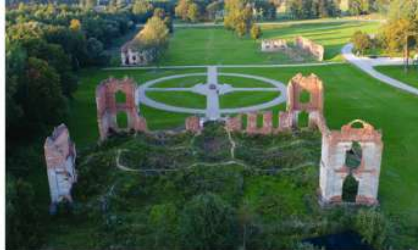
Merkinės dvaro sodybos griuvėsiai iš paukščio skrydžio

Autonomiškoje respublikoje prezidentavęs P. K. Bžostovskis panaikino tuo metu klestėjusią baudžiavą, t. y. atodirbio rentą pakeitė mokesčiu. Jis išdalijo žemę valstiečiams ir leido jiems laisvai verstis prekyba ir amatais. Respublikos prezidentas ir valstiečių seimas rūpinosi piliečių gyvenimu, kultūra ir švietimu. Paulava turėjo savo įstatymus, pinigų, herbą, vėliavą, mokyklą, miliciją ir gydytoją.