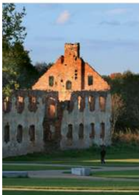
Dvaro sodybos griuvėsiai

Merkio aukštupyje išsidėstęs Šalčininkų rajono Merkinės kaimas. Į jį lankytojus traukia Merkinės dvaras, tiksliau, tai, kas iš šios dvaro sodybos liko, – buvusių didingų rūmų griuvėsiai. Kadais