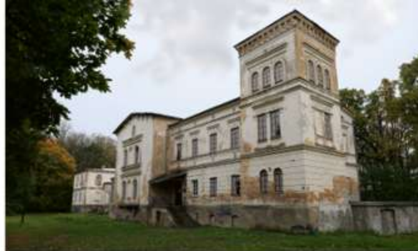
Belvederio dvaro rūmai

Papildoma informacija Dvaras privatus, tačiau yra galimybė susitarus jame apsilankyti.