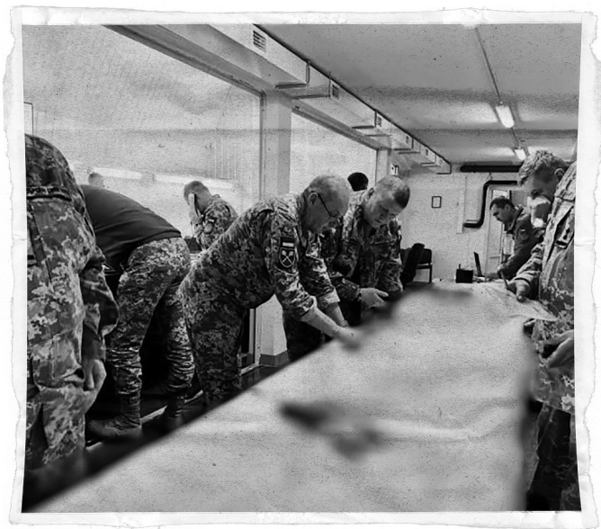
Viktoras Muženka ir Valerijus Zalužnas kariuomenės valdymo punkte. 2022 m. vasario 24 d.

Maždaug ketvirtą po pietų į kambarį atnešė arbatos metaliniame bidone, samtį, plastikinius puodelius ir kelias lėkštes sumuštinių su pigia dešra ir sūriu. Visi juos valgė nežiūrėdami. Aš pilsčiau generolams arbatą ir nepastebimai nurinkdavau tuščius indus.