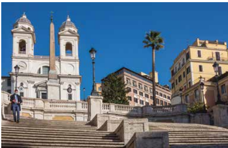
Ispanijos laiptai ir Trinità dei Monti bažnyčia