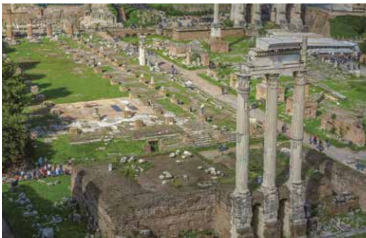
Trys kolonos, žyminčios Dioskūrų Kastoro ir Polukso šventovės liekanas

apie romėnų pergalę. Jiems dedikuota šventykla forume primena šį stebuklą ir Regilo mūšį.