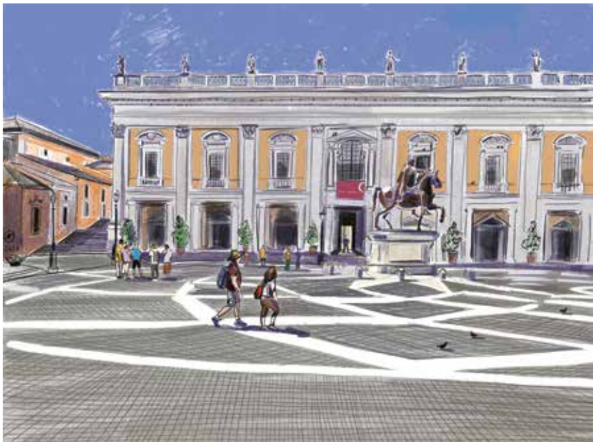
Kapitolijaus aikštė su Marko Aurelijaus statula

Šventasis kelias kilo Kapitolijaus šlaitu ir baigdavosi priešais didžiulę šventyklą, skirtą Jupiteriui Geriausiajam Galingiausiam – Jupiter Optimus Maximus.