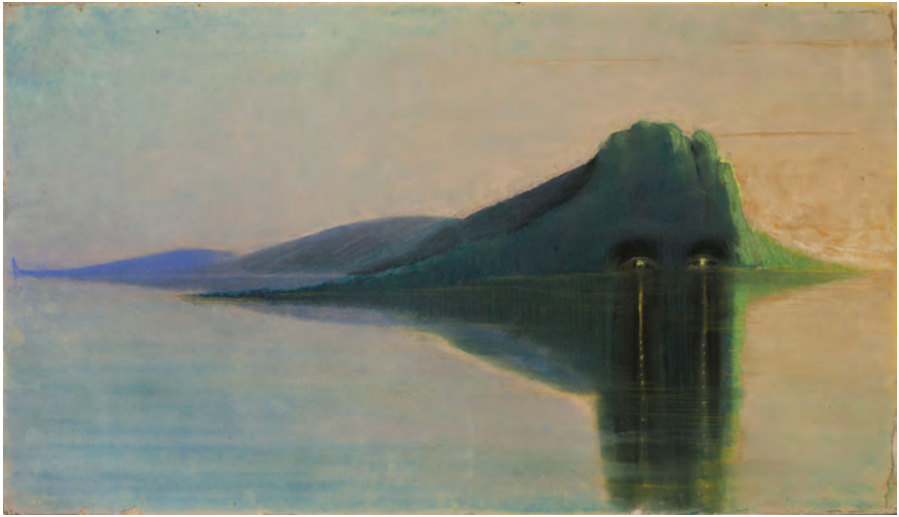
M. K. Čiurlionis. Ramybė . 1903–1904. Popierius, pastelė. ČDM

valties regėti Veisiejus supusių ežerų Ančios, Veisiejų, Snaigyno tolimuose horizontuose krantų atspindžiai vandenyje, kurie visada man primena Čiurlionio paveikslo „Ramybės“ motyvus. Šie spalvingi vakaro saulės ir sutemų nutvieksti vaizdai jau daug dešimtmečių „lydi“ mane sapnuose, skatindami periodiškoms išvykoms, prisidengiant meškeriojimo aistra, į čiurlioniškų motyvų kupiną vaikystės ežerų prarastojo rojaus pasaulį.