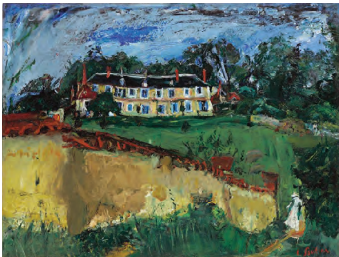
Chaim Soutine. Senas namas greta Šartro . 1934. Drobė, aliejus

siam Ch. Soutine'ui buvo palankesnis – jis išvyko į Paryžių ir po daugybės nepriteklių metų sulaukė išsvajoto kūrybos pripažinimo.