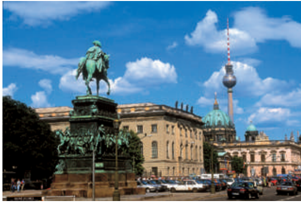
62 psl. viršuje: šiame Unter den Linden alėjos vaizde matoma Frydricho Didžiojo statula, universitetas, Vokietijos nacionalinis muziejus, katedra bei didžiulė radijo ir televizijos antena su apžvalgos bokštu, iš kurio atsiveria nuostabus vaizdas į miestą.